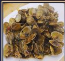
ผัดหอยลาย