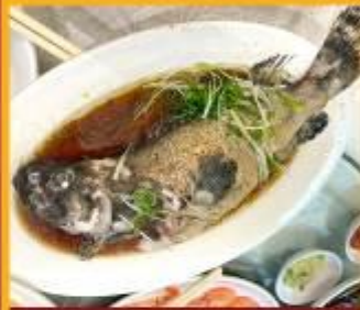
ปลาหนึ่งซีอิ้ว