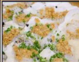
หอยเชลล์อบวุ้นเส้น