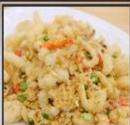
หมึกทอดกระเทียม