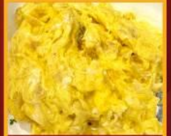
ไข่เจียวทรงเครื่อง