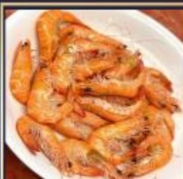
กุ้งหวานลวก