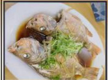
ปลาหนึ่งซีอิ๊ว